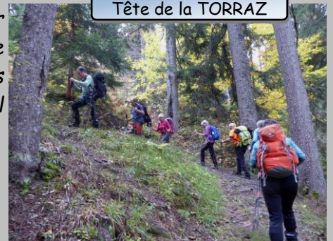
Tête de la TORRAZ

Il en a été l'un des artisans dès le mardi 15 octobre à la tête de TORRAZ pour fêter dignement ce brevet.