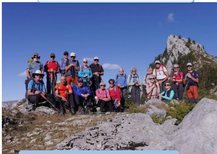
Sentier des Moines - Roc de Chère